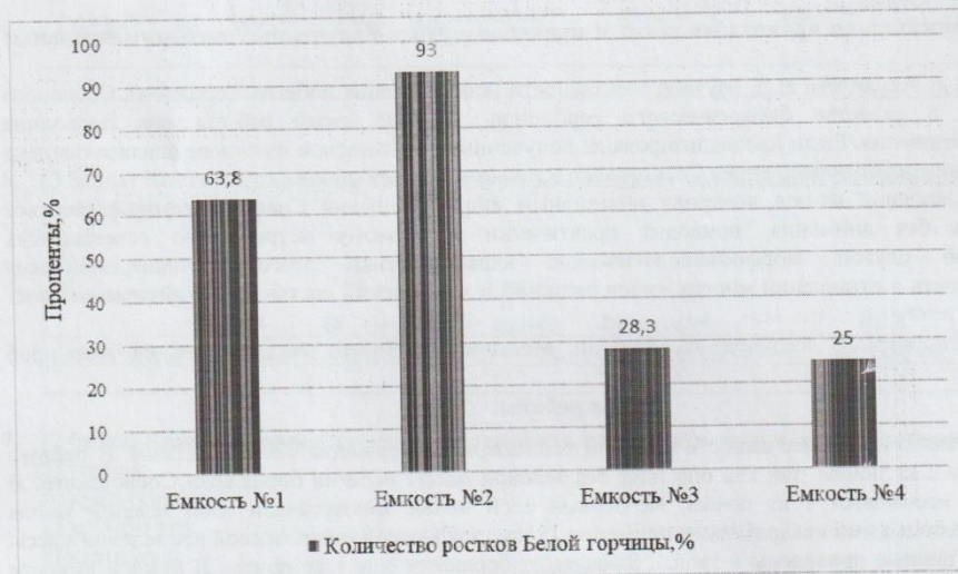
Рис.1. Данные по количеству проросших семян (%) в каждой ёмкости 4.11.20.

4 ноября 2020 в те же самые ёмкости не меняя почву, не добавляя зеленую массу борщевика Сосновского, посадили такое же количество семян Белой горчицы (по 60 штук), для того чтобы проверить сохраняет ли зеленая масса борщевика Сосновского, свои свойства на протяжении длительного времени. На протяжении всего времени рост горчицы во всех ящиках был одинаковый. Сбор растительного материала был произведен 4 декабря 2020 года.