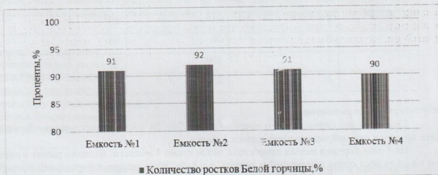
Рис.2. Данные по количеству проросших семян (%) в каждой ёмкости 4.12.2020.

Данные по количеству проросших семян (%) в каждой ёмкости во время второго эксперимента приведены на рис.2.